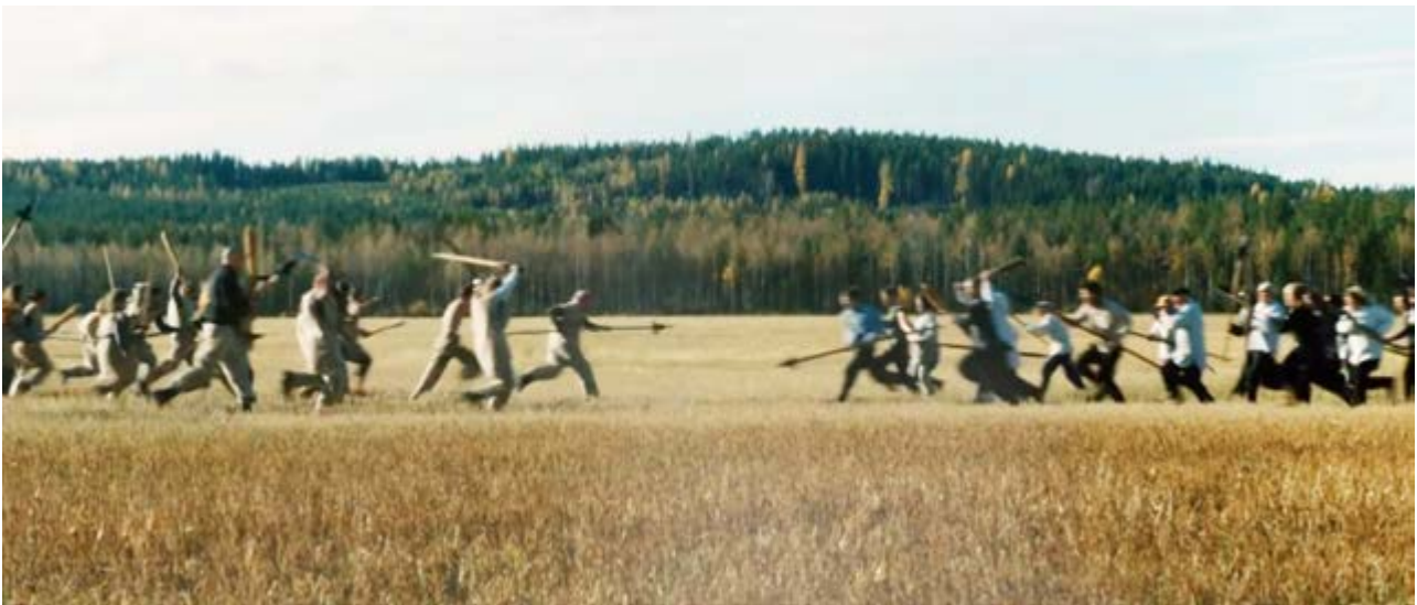
Loukasmäen Taistelun kuvauksissa Soinissa

Vuonna 2016 Digiperintö-hanke järjesti kaikkiaan kolme työpajasarjaa, jotka kaikki keskittyivät elokuvatoimintaan. Hanke käynnisti työpajayhteistyön Loukasmäen taistelu-nimisen elokuvatuotannon kanssa. Sen tarkoituksena oli tutustuttaa elokuvatoiminnasta kiinnostuneita harrastajanäyttelijöitä sekä muiden alan harrastajia elokuvamaailman saloihin. Työpajatoiminta toteutettiin neljässä osassa elokuvan kuvausten yhteydessä 28. helmikuuta, 30. toukokuuta, 14. elokuuta sekä 25. syyskuuta. Osallistujia toimintaan ilmoittautui hankkeen ja Loukasmäen tekijöiden kokoon kutsumana ympäri Etelä-Pohjanmaata vajaa sata vapaaehtoista. Päivien aikana he osallistuivat puvustukseen, maskeeraamiseen, näyttelemiseen sekä erilaisiin avustajien rooleihin. Loukasmäen taistelu valmistuu vuosien 2017 ja 2018 aikana.