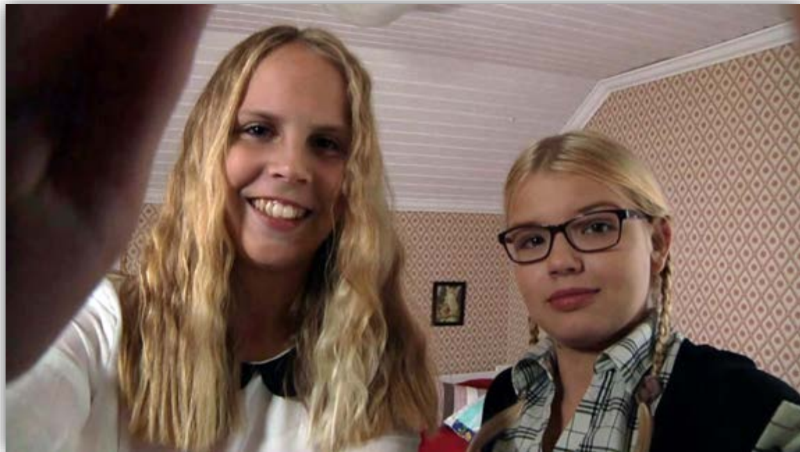
Työpajalaisia Lapuan Haapakoskelta