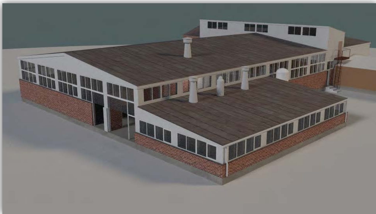
Mallinnettu lataamo 1970-luvulta