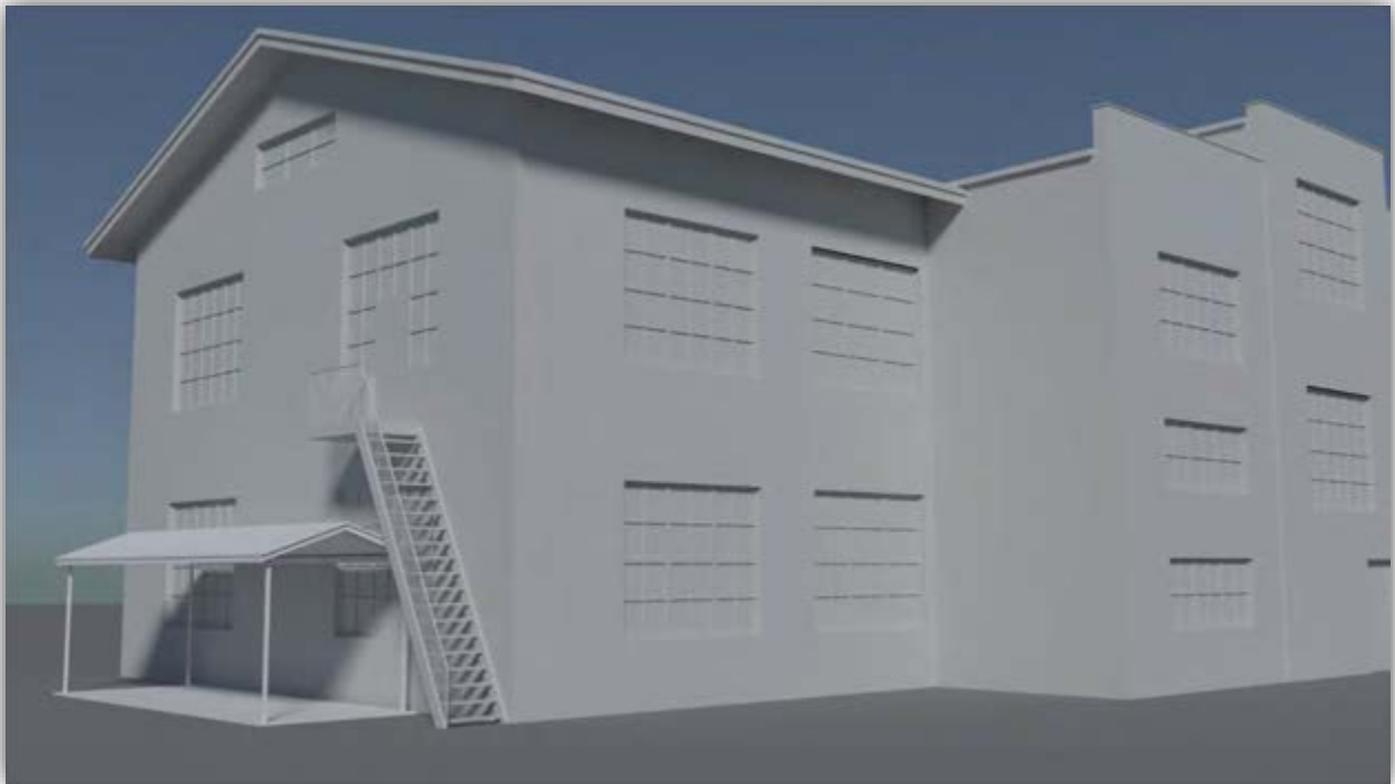
Pintakäsittelyä vaille valmis työkalutehdas

Kesään 2016 mennessä malleja oli saatu toteutettua jo yli puolet Vanhan Paukun rakennuskannasta, joten syksyllä 2016 voitiin keskittyä vielä Torstilan, pienoiskiväärilataamon, lyijylankaosaston, johtajien talon sekä tilikonttorin mallintamiseen. Näiden lisäksi päätettiin vielä tehdä muutama pyörävarasto ja vaja Paukun alueelta, jotta kuva alueesta muistuttaisi mahdollisimman paljon 1970-luvun tehdasaluetta. Mallit näistä kaikista rakennuksista saatiin valmiiksi vuoden 2016 aikana, osasta puuttui vielä pintagrafiikat, niiden lopputyöstö toteutettiin alkuvuoden 2017 aikana.