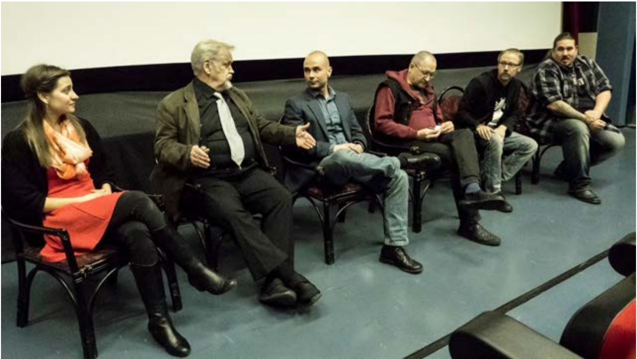
Bottomland Film Festival 2016

Vuoden 2016 BoFF, eli Bottomland Film Festival, järjestettiin kaksipäiväisenä kasvaneen oheistapahtumakiinnostuksen ansiosta 4. - 5.11. Ensimmäisenä päivänä järjestettiin yhteistyössä Wanhan Karhunmäen kanssa Halloween-ilta, jossa näytettiin edellisenä vuotena BoFFin päätapahtumassa esitetty Surmanlaakso. Teatterina toimi Wanhan Karhunmäen juhlasali, jossa katsojia oli kaikkiaan 30. Digiperintö-hanke ja Wanha Karhunmäki toteuttivat yhteistyön pääasiassa markkinointi-yhteistyönä, jotta välttyttäisiin päällekkäisyyksiltä BoFFin päätapahtuman kanssa. Samana iltana järjestettiin BoFF-aktiivien toimesta oheistapahtuma BoFF goes Rock Lapuan Hovissa. Sen tapahtuman tarkoitus oli kerätä yhteen alueen bändit ja esitellä heidän musiikkivideoitansa. Tapahtuma keräsi suuren suosion ja tupa oli melkein täynnä. Musiikkivideoita tapahtumassa esitettiin yli 20. BoFF goes Rock oli tapahtumana ilmainen.